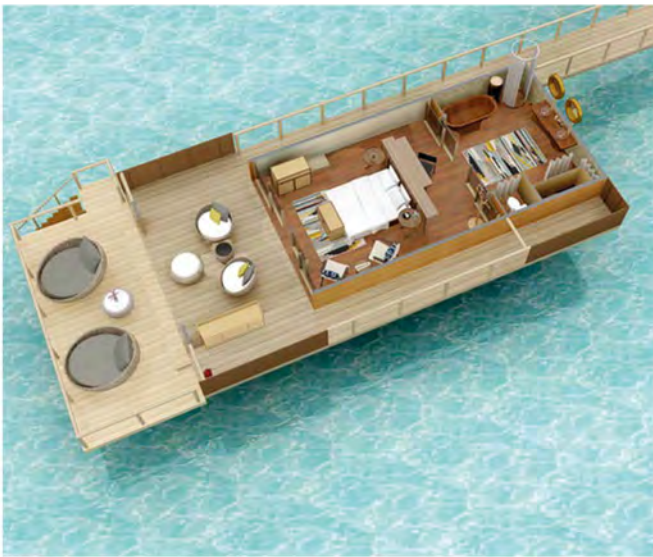
水上小屋 ( Overwater Bungalow )