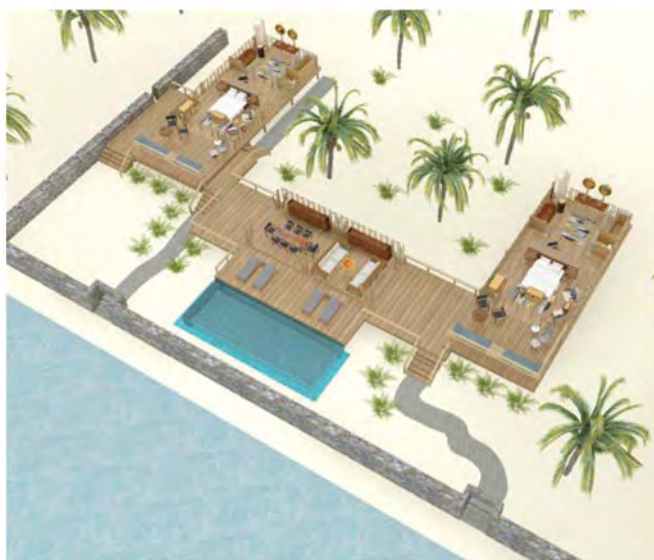
双卧无边泳池别墅 (2-bed Infinity Pool Villa)