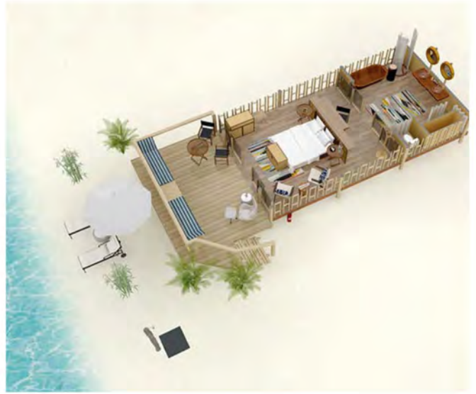
海滩套房 ( Beach Suite )