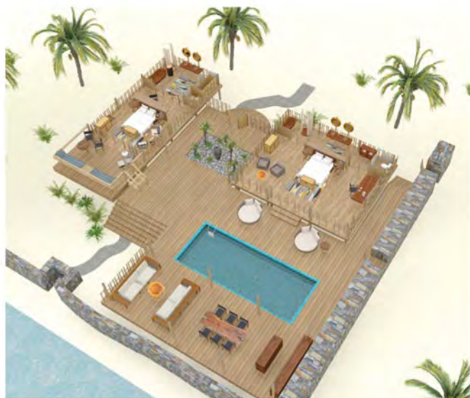
双卧泳池别墅 (2-bed Pool Villa)