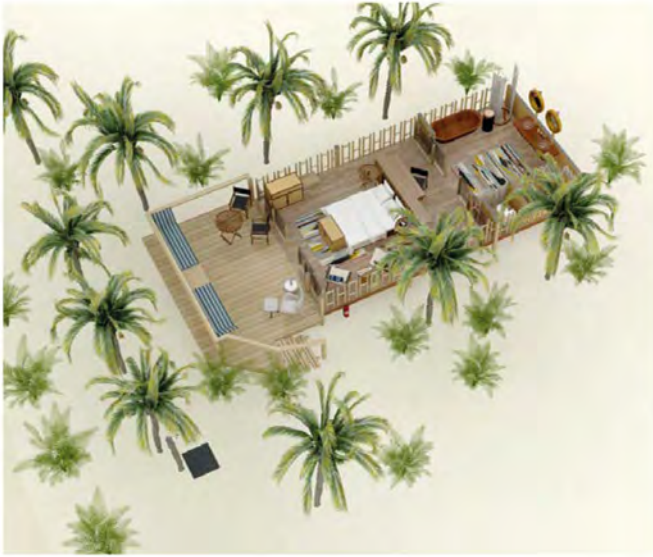
花园套房 ( Garden Suite )